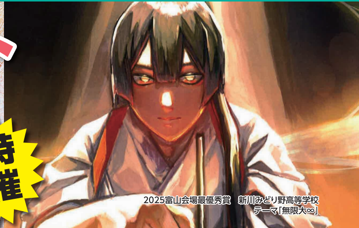
2025富山会場最優秀賞 新川みどり野高等学校 テーマ「無限大」