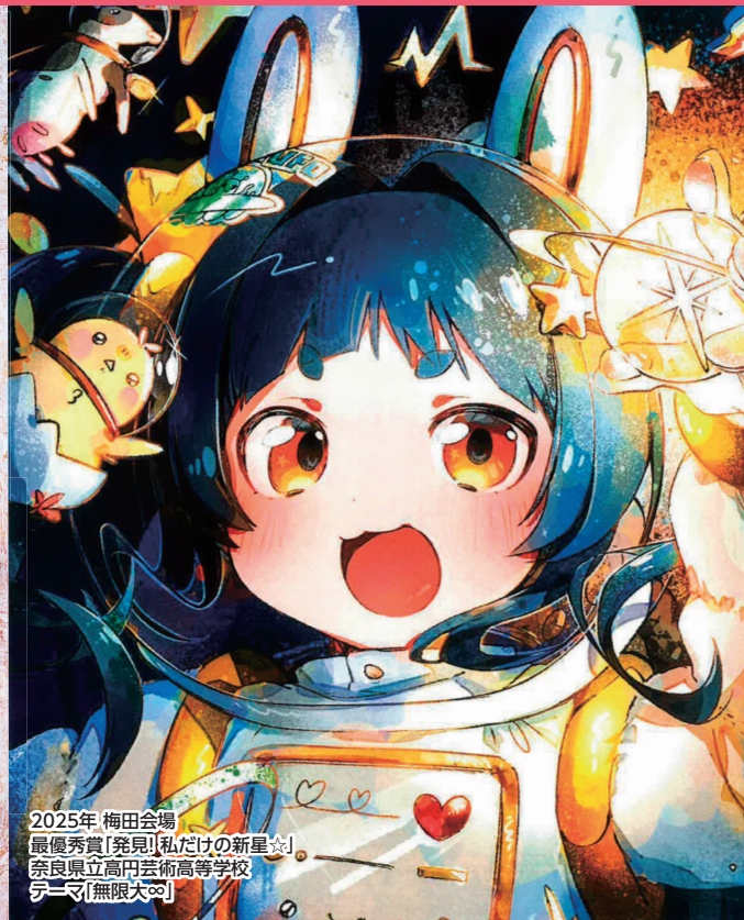
2025年 梅田会場 最優秀賞[発見!私だけの新星☆] 奈良県立高円芸術高等学校 テーマ[無限大☆]